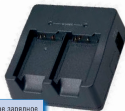
Сдвоенное зарядное устройство HA-F32DCHG