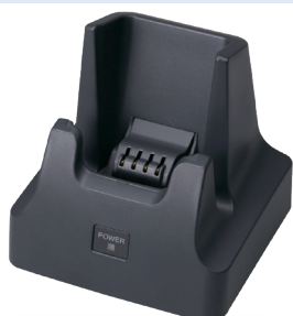
Док-станция USB/Ethernet (с функцией подзарядки) HA-F62IO