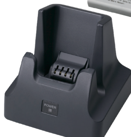
Док-станция USB (с функцией подзарядки) HA-F60IO