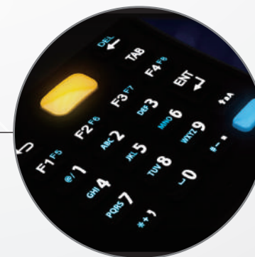
Светодиодная подсветка клавиатуры