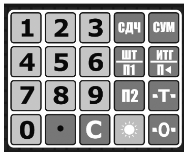
Рис. 3. Клавиатура