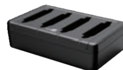
Зарядное устройство на 4 слота