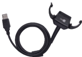
Кабель с защелкой