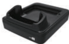
Коммуникационная подставка/ зарядное устройство